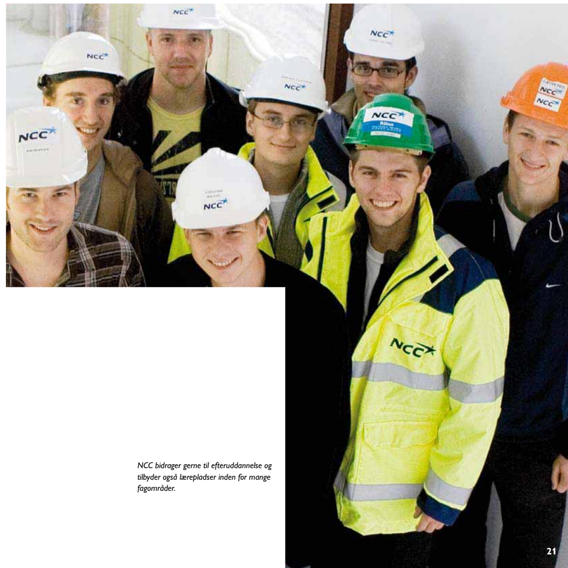
NCC bidrager gerne til efteruddannelse og tilbyder også lærepladser inden for mange fagområder.

Pensionsordninger: Hvis du vil oprette eller ændre i de af dine private pensionsordninger, som administreres af NCC, skal du henvende dig til pensionselskabet eller pengeinstituttet, som sender aftalen til lønkontoret.